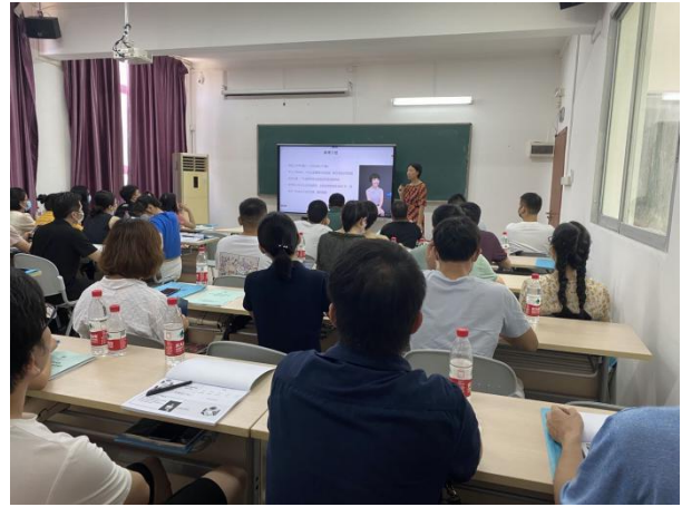
第三期化妆品质量安全负责人培训班课堂