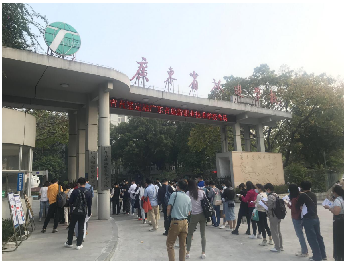
2020年健康管理师省直鉴定站广东省旅游职业技术学校考场