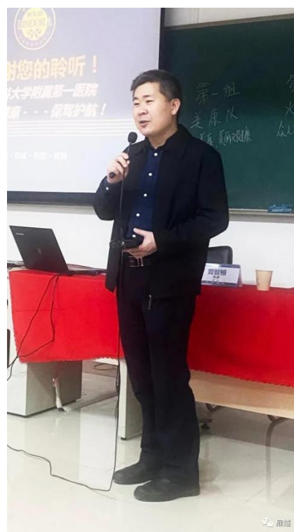
《肥胖与心脑血管疾病的关系》