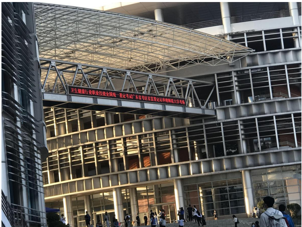
2020 年健康管理师省直鉴定站华南师范大学考场