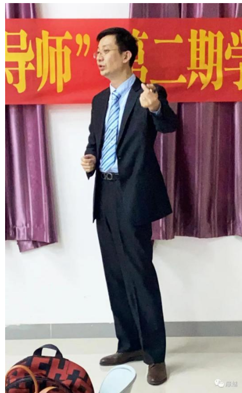
《“迈开腿”—体重管理与运动的关系》