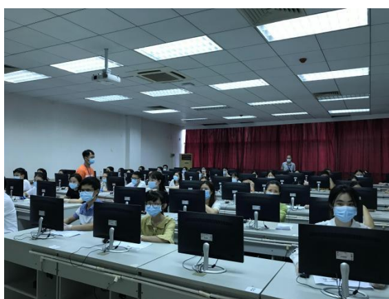
卫护考人机对话考试广东药科大学考场试室