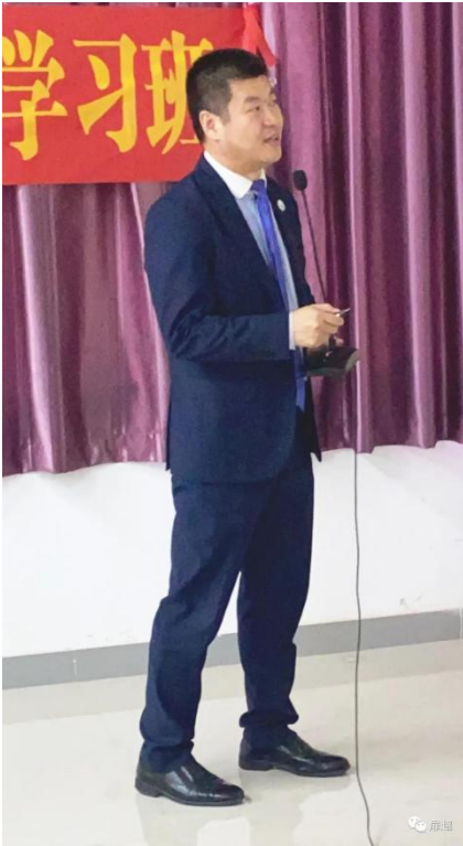
《肥胖与糖尿病痛风的关系》