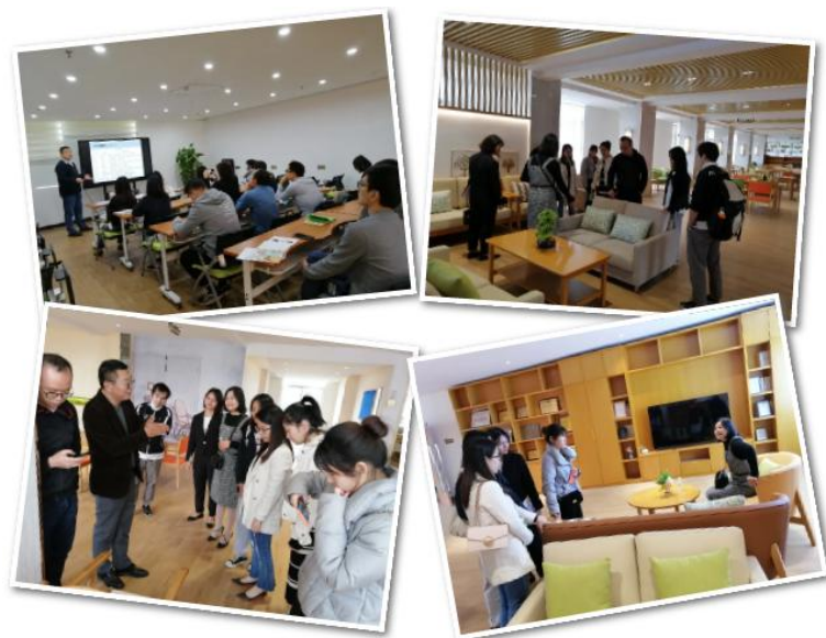
行业考察 资源对接