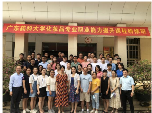
第四期化妆品质量安全负责人培训班