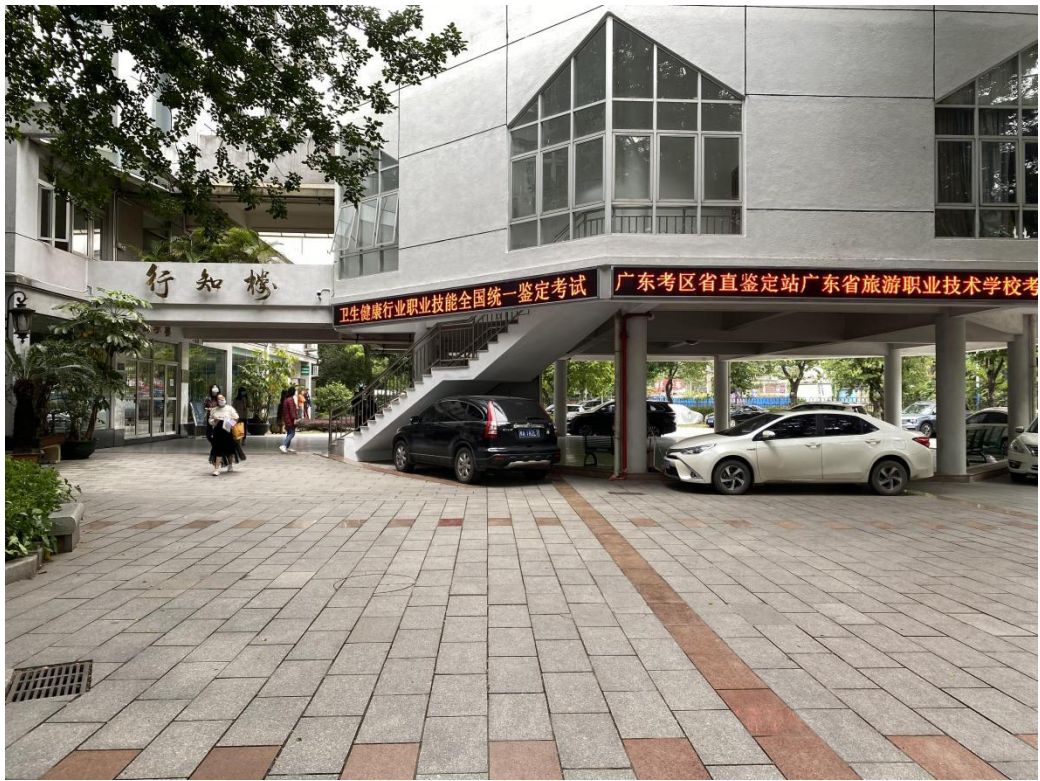
2020 年健康管理师省直鉴定站广东省旅游职业技术学校考场