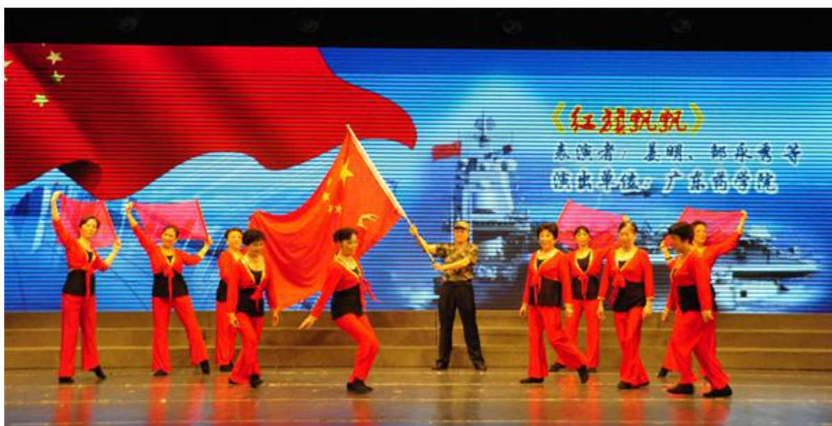
我院“老教协会”舞蹈队参加省直单位庆“七一”文艺展演