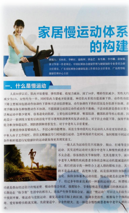
(在广东省委干部保健局的运动与健康专刊上全文刊登)