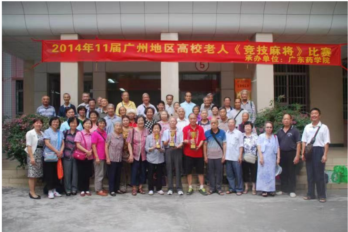
2014年11届广州地区高校老人《竞技麻将》比赛