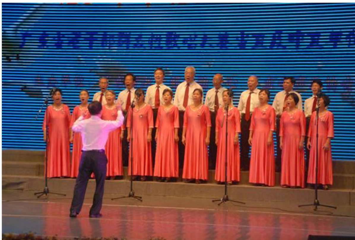
我校老干部合唱团荣获广东省老干部群众性歌唱大赛银奖