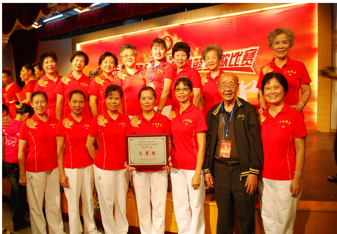
广东省第七届老年人运动会健身操比赛三等奖