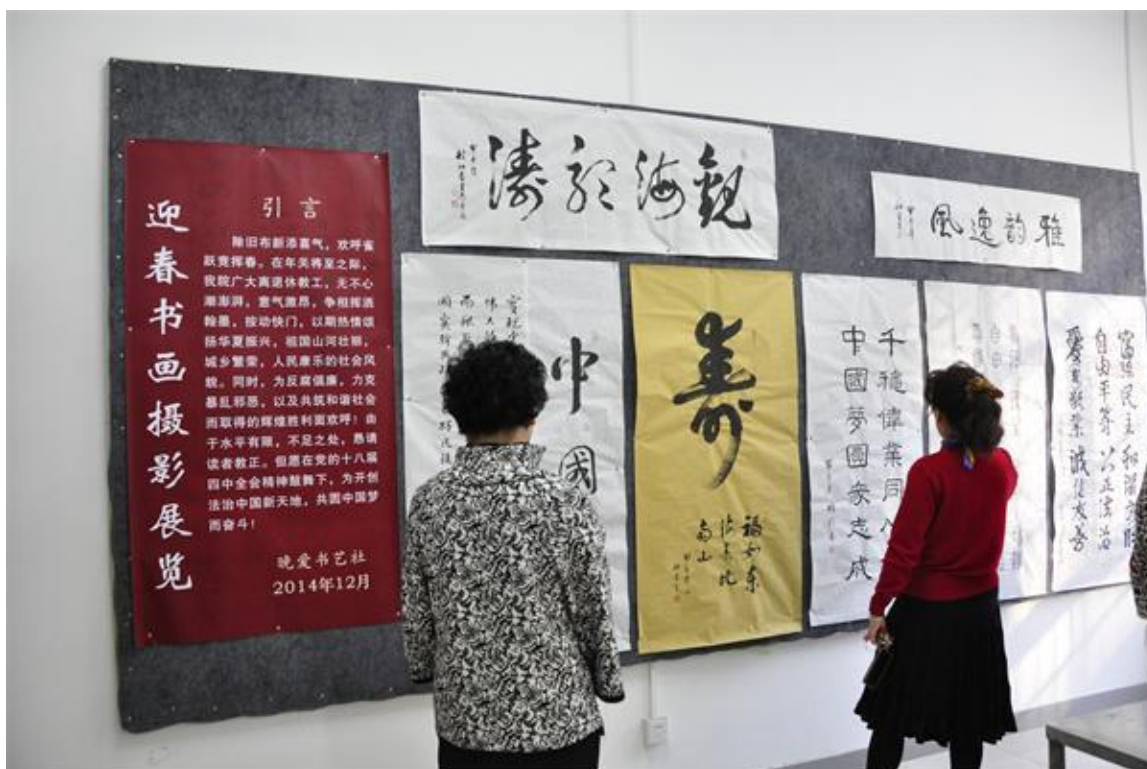
老同志新年迎春书画、摄影作品展在宝岗校区举办