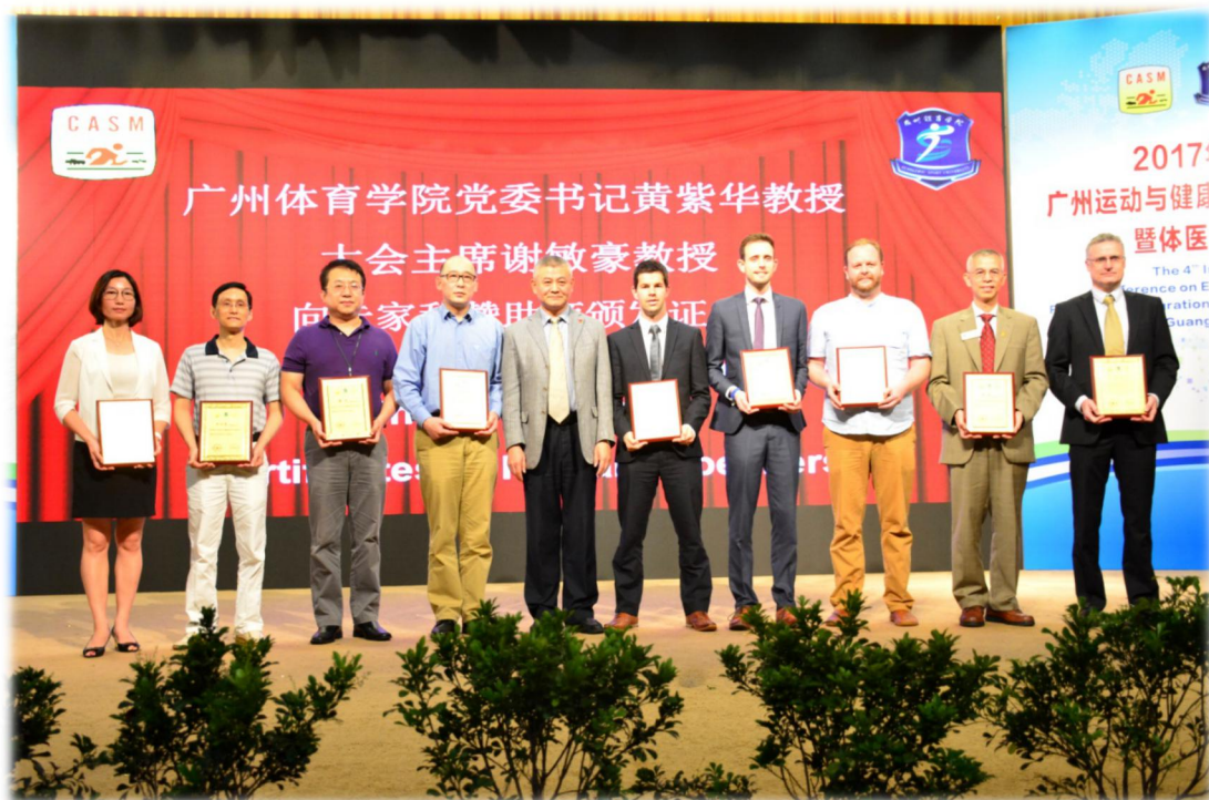
(在 2017 年第四届运动与健康国际学术会议上“家居功能运动”得到国外专家认可)